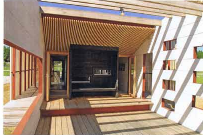
Altanendåcket med pergola är placerad mellan postadsdelen och förrådet.

– Vi har valt att använda limträbalkar för att rama in uteplatsen och har integrerat uteplatsens