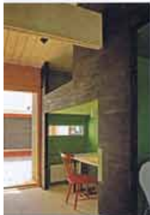
Bäddarna har flyttats uppåt och likar koger. Under dem finns utrymme för arbets- eller lekplats.