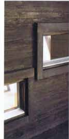
De två koierna i återn har varsin asymmetriskt placerat fönster som speglar de hål i uteplatsens plank som bildats genom att limträbalkarna försjuttits.