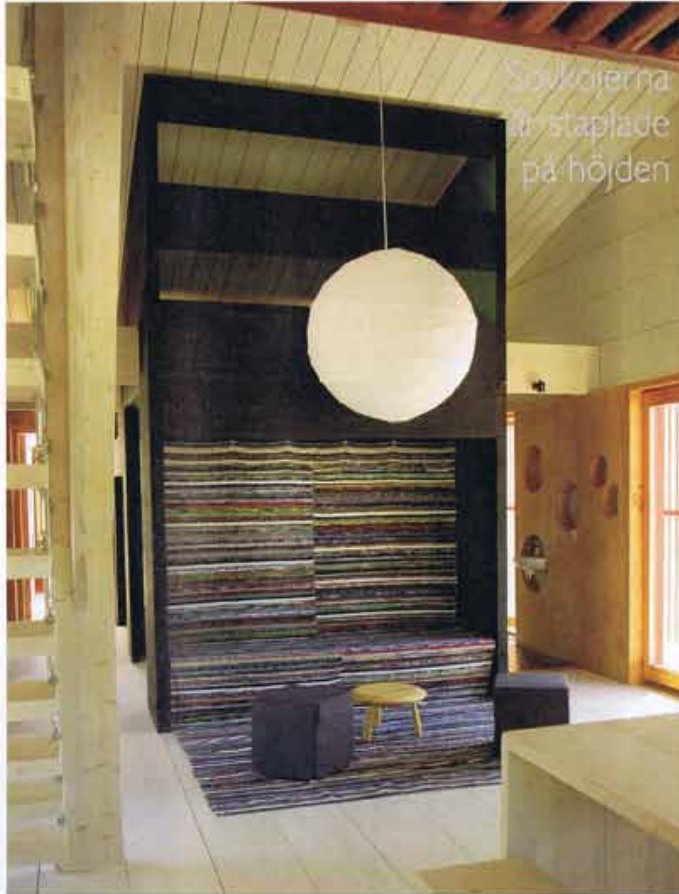
Sovkoierna är staplade på höjden